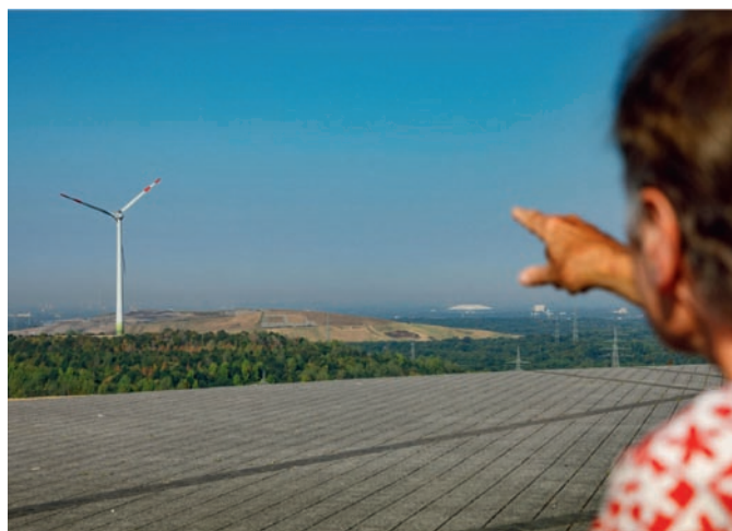
Fig. 1. Employment stimuli 1.

The imminent coal exit in Germany is being proactively and comprehensively flanked by structural policy, in particular to compensate for the resulting job losses and to give new employment stimuli to the coal mining regions (Figure 1). It is noteworthy,