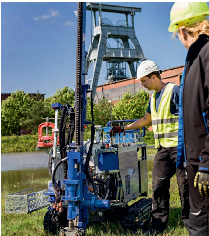
Fig. 2. Employment stimuli 2.

Bild 2. Beschäftigungsimpulse 2.